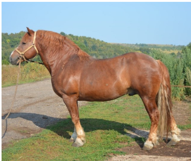
Русский тяжеловоз. Современный снимок

Арденов в Шагирт доставили в 1927 году из Першинского конного завода (Тульская область), куда они, в свою очередь, были переданы в 1925 году из конюшен знаменитого Хреновского завода (село Хреновое Воронежской области), основанного ещё в 1776 году графом Алексеем Григорьевичем Орловым — Чесменским. Надеюсь, что шагиртские краеведы ещё напишут историю 6-го Уральского конного завода, и пусть мои записки им в этом помогут.